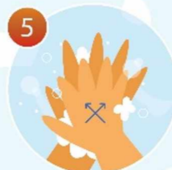
5 Потрите между пальцами, сложив ладони