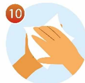
10 Вытрите руки бумажным или личным полотенцем насухо