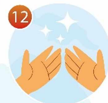
12 Теперь ваши руки чистые!