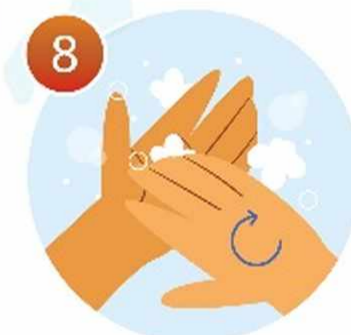
8 Потрите под ногтями