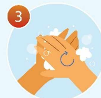
3 Вспеньте мыло