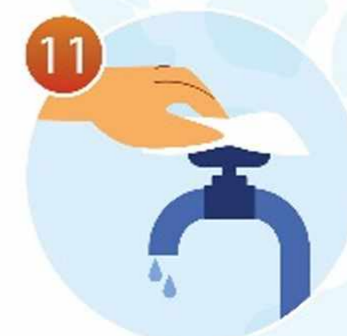
11 Закройте кран с помощью одноразовой салфетки