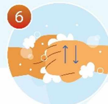
6 Потрите пальцы, сложив руки в замок