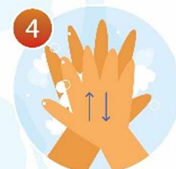
4 Потрите тыльные стороны ладоней