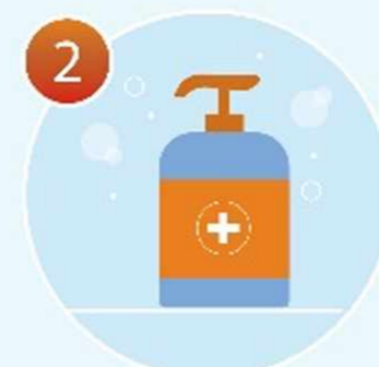
2 Нанесите мыло Продолжительность намыливания 20 секунд