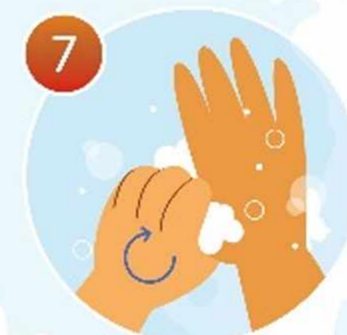
7 Потрите большие пальцы