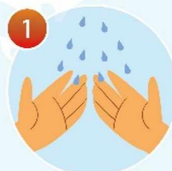
1 Намочите руки