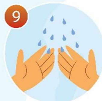
9 Смойте мыло