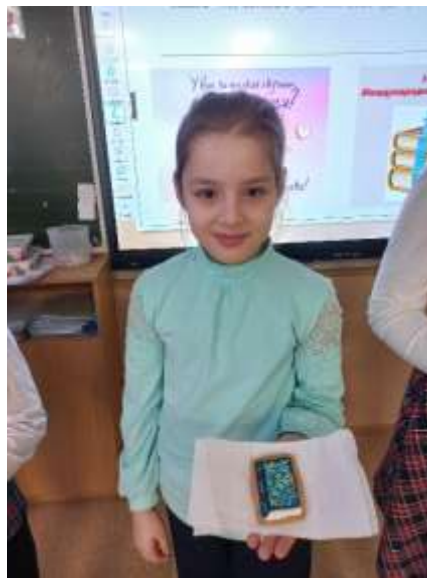
Победители конкурса «Лучший читатель» - учащиеся 3А класса.