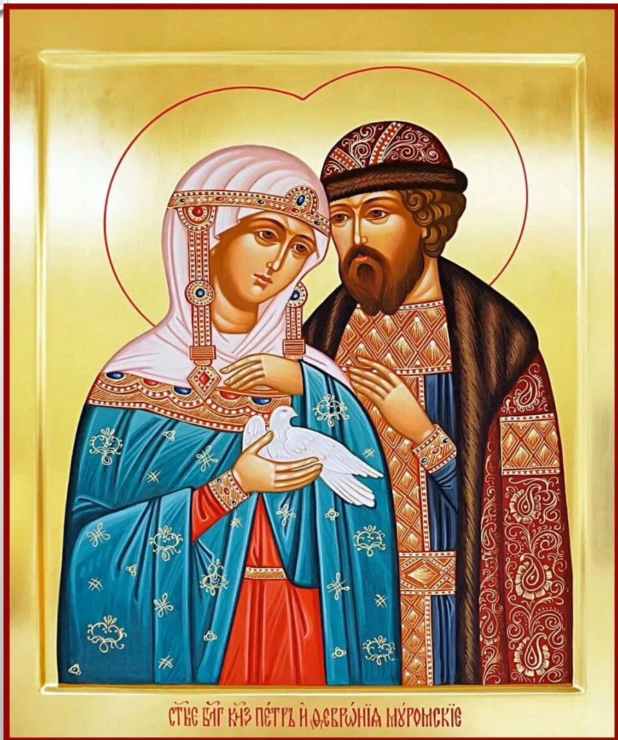
Благодарные Святыя Пётр и Феврония Муромские