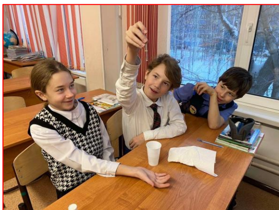
Фото - материалы о событиях Недели Науки: