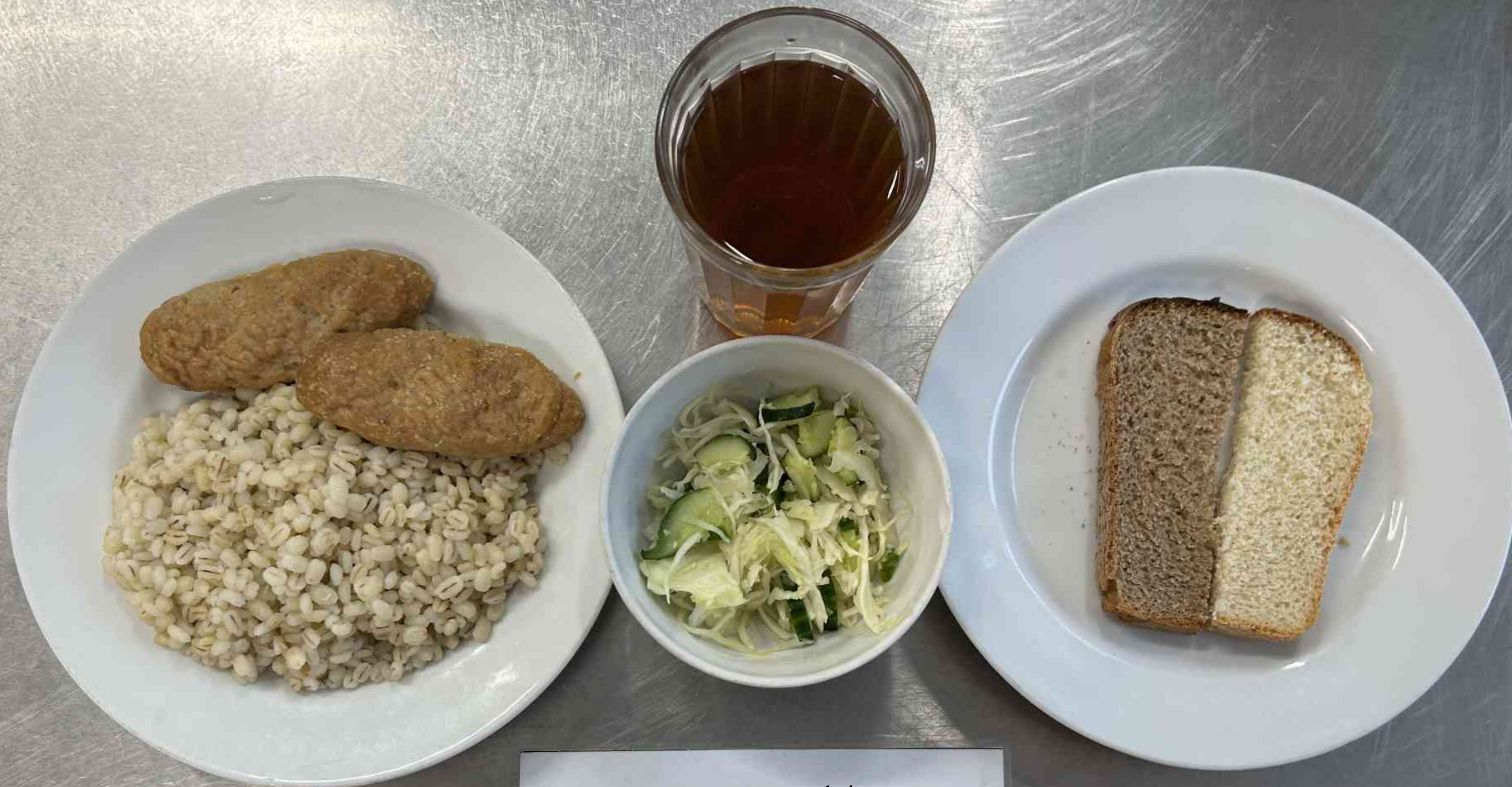
Бесплатное питание 1-4 классы (1 СМЕНА) – ЗАВТРАК