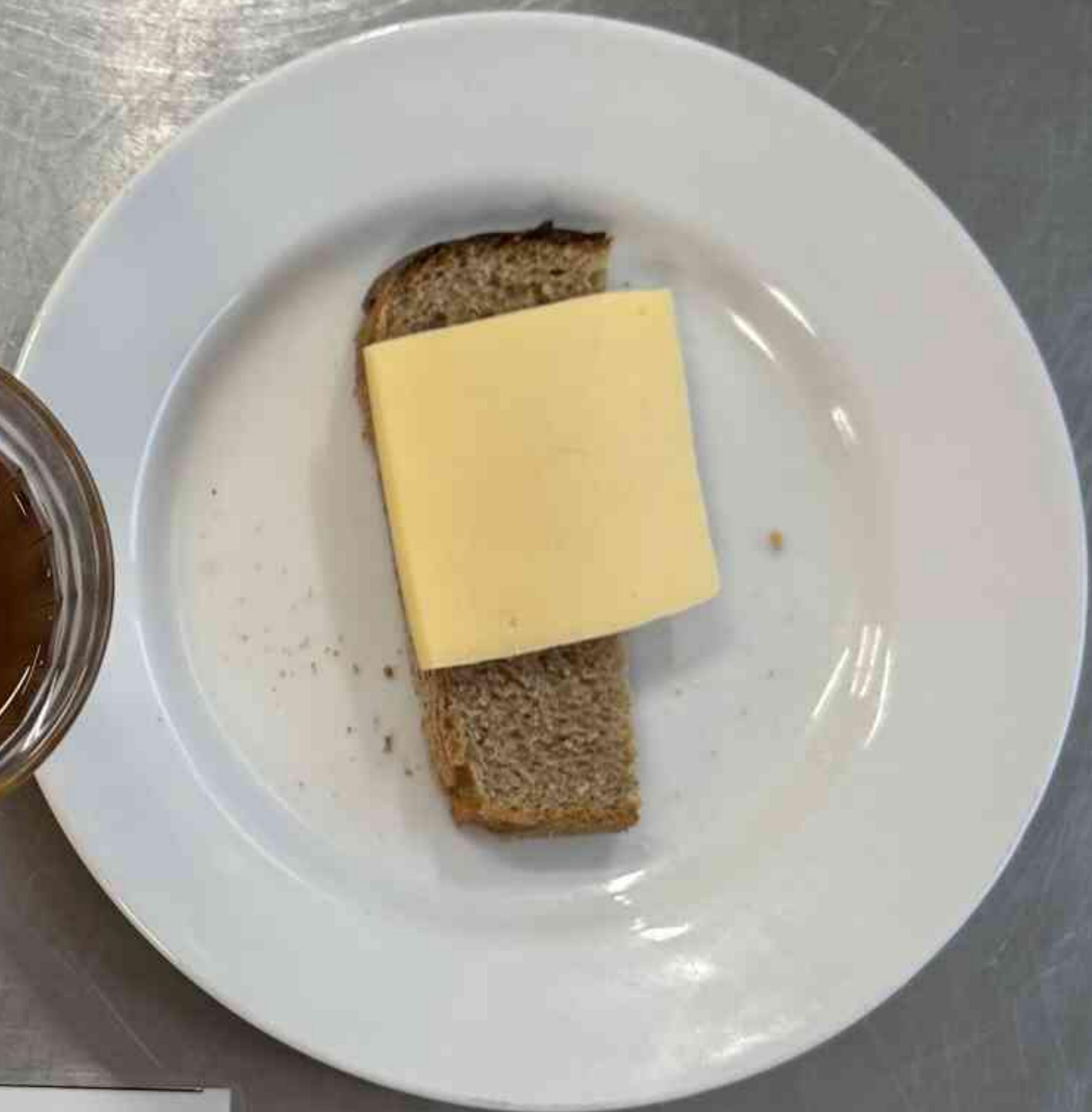
Платное питание 5-11 кл. (1 СМЕНА) – ЗАВТРАК