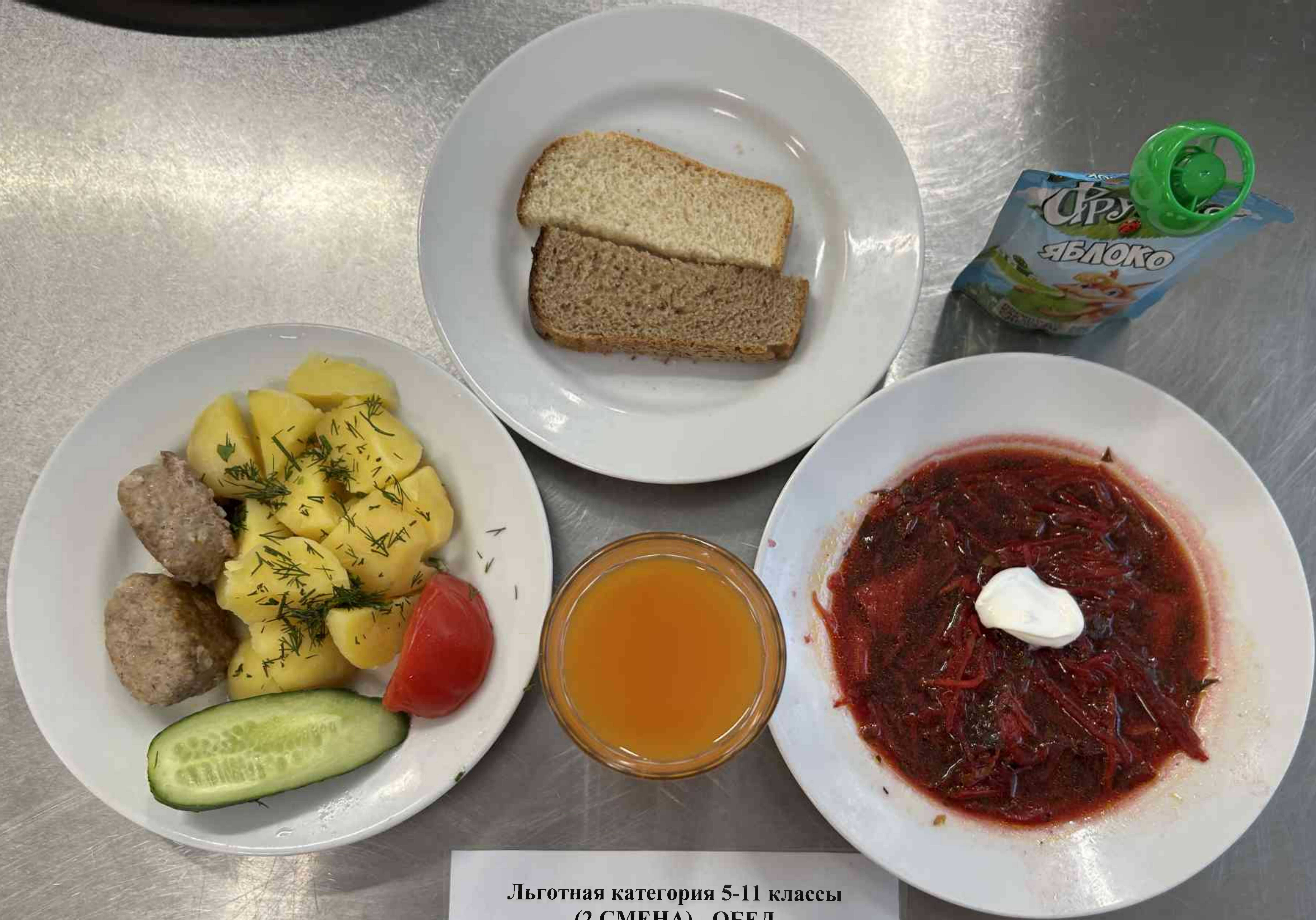
Льготная категория 5-11 классы (2 СМЕНА) - ОБЕД