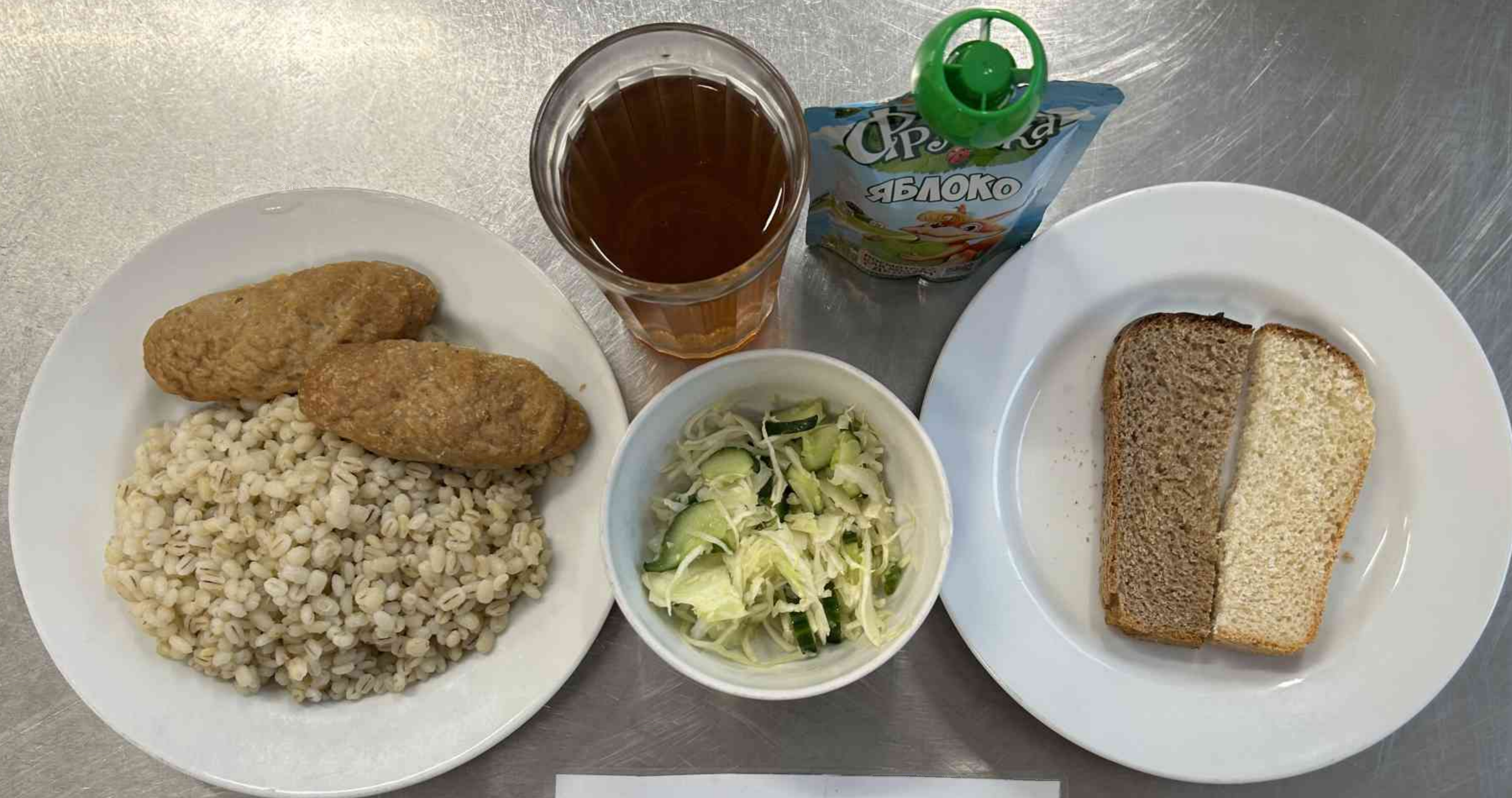
Льготная категория 1-4 классы (1 СМЕНА) – ЗАВТРАК