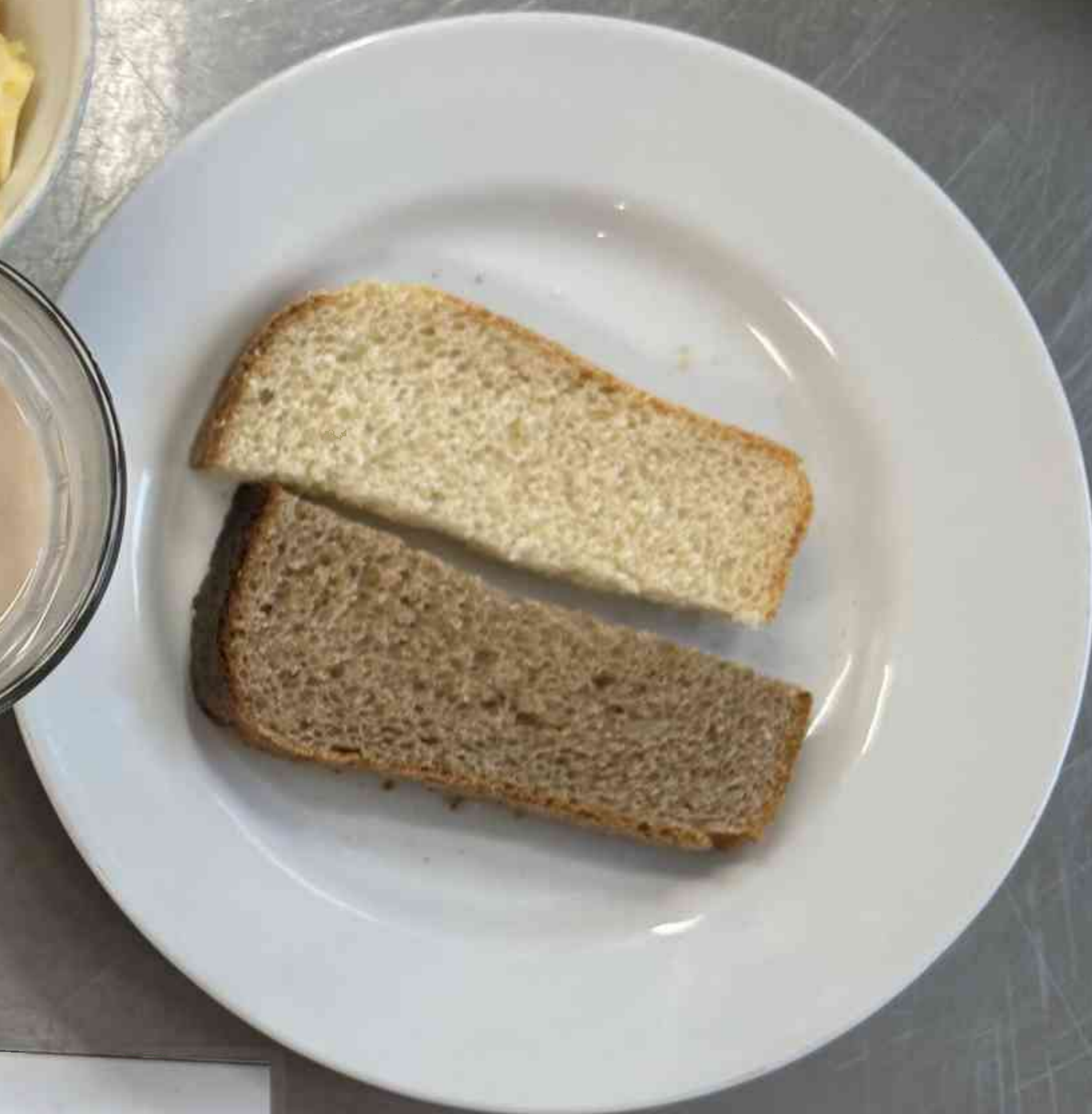
Бесплатное питание 5-11