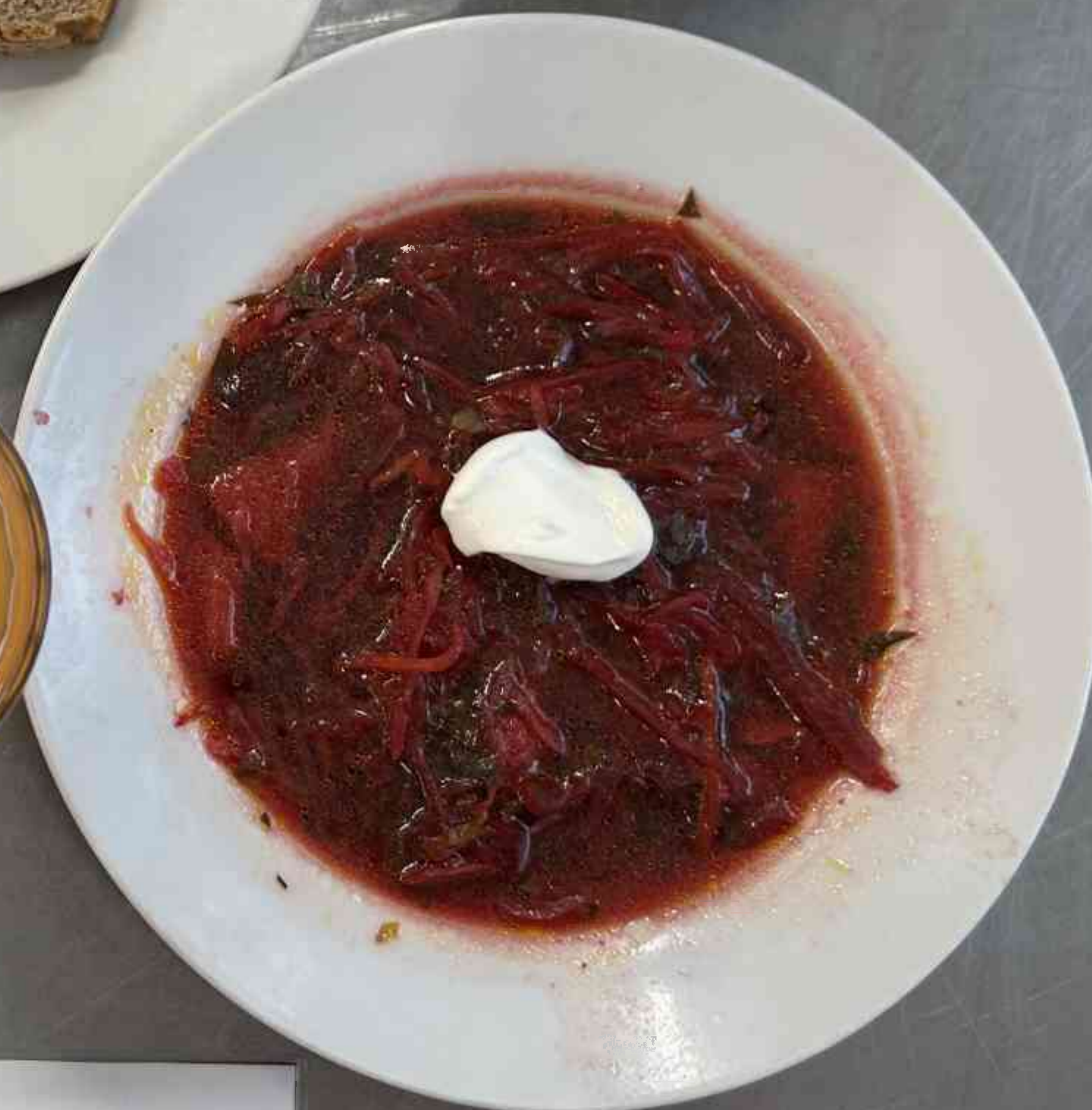
Бесплатное питание 1-4 классы (2 СМЕНА) – ОБЕД