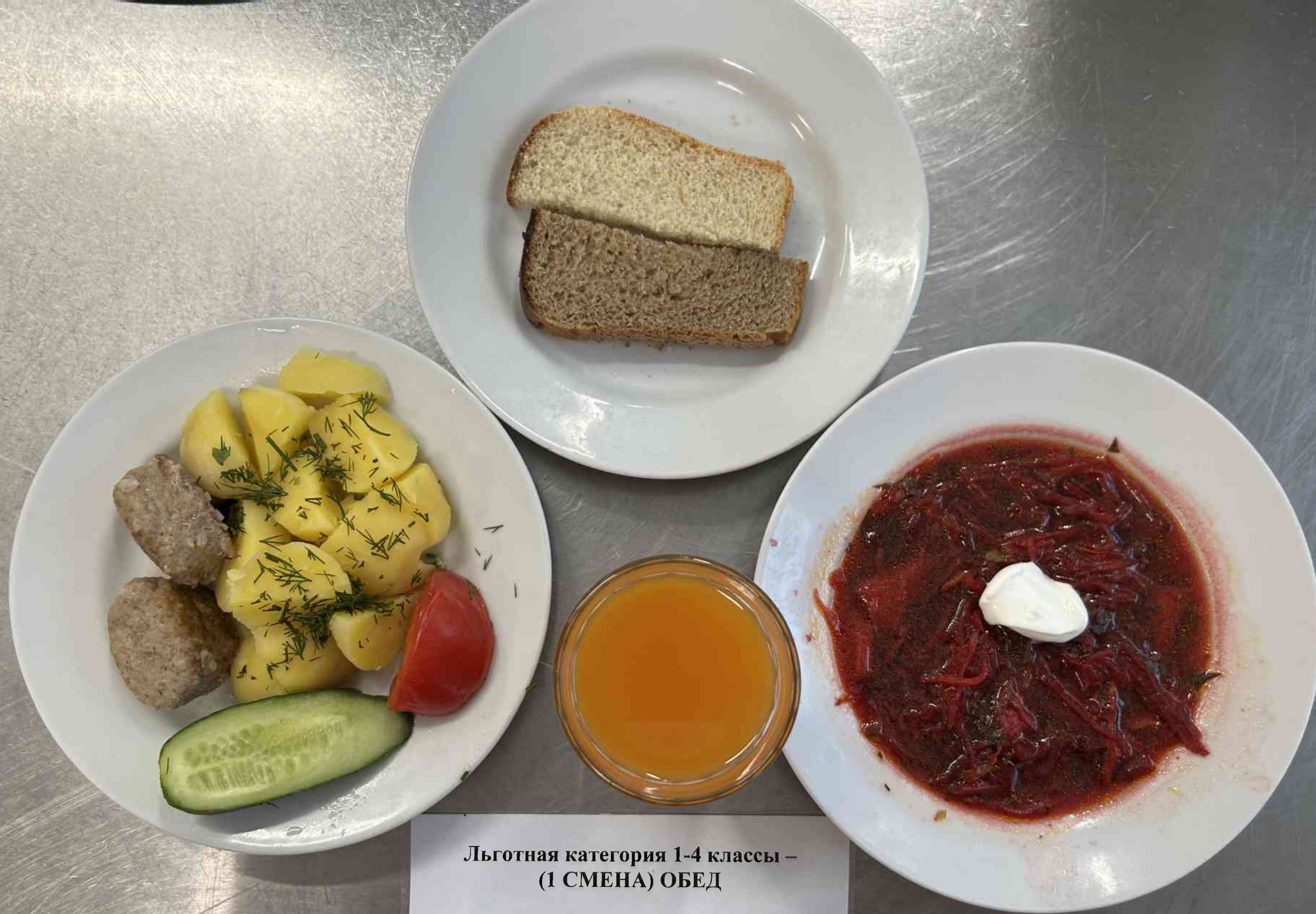
Льготная категория 1-4 классы – (1 СМЕНА) ОБЕД