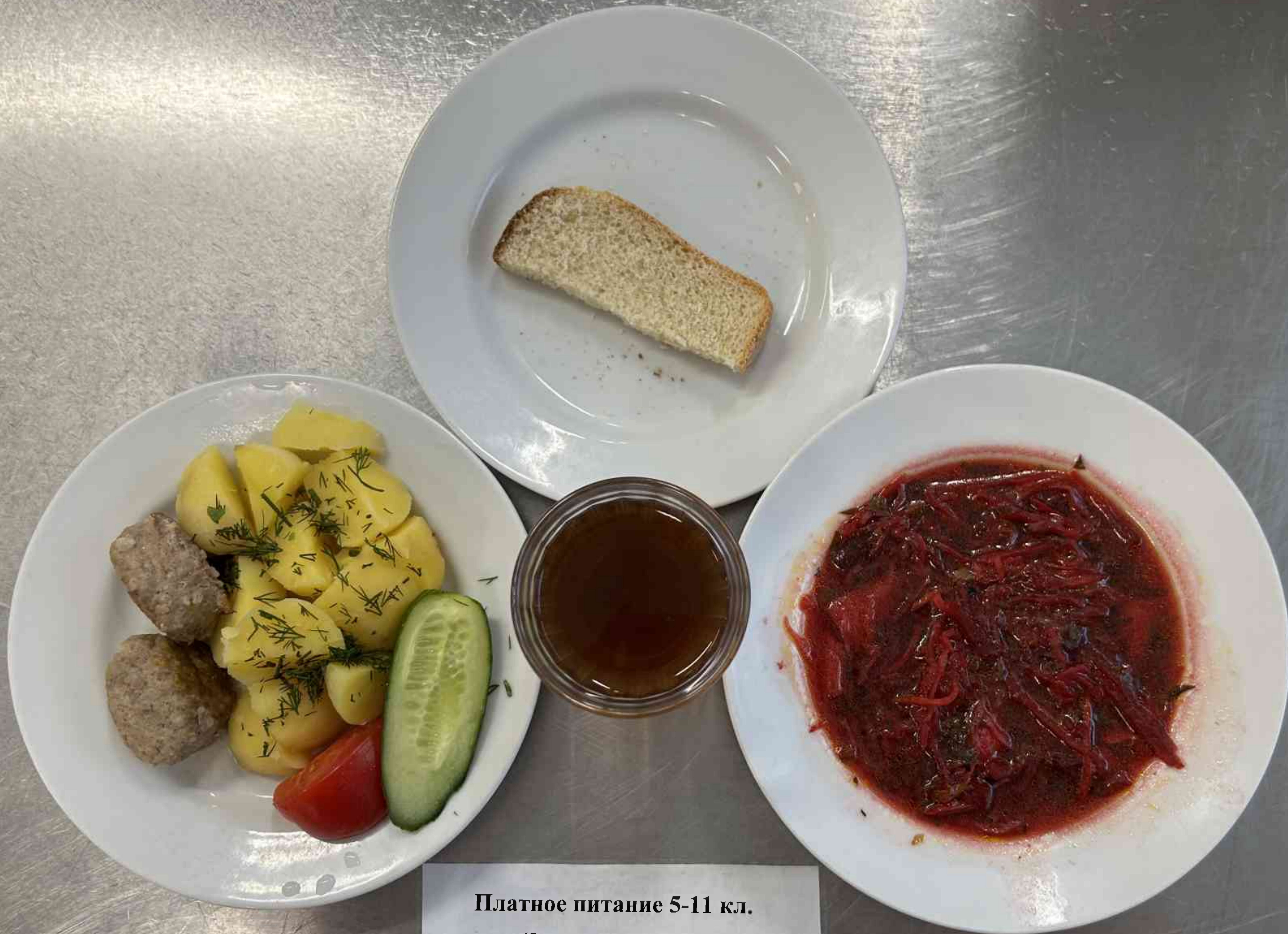
Платное питание 5-11 кл. (2 смена) - ОБЕД