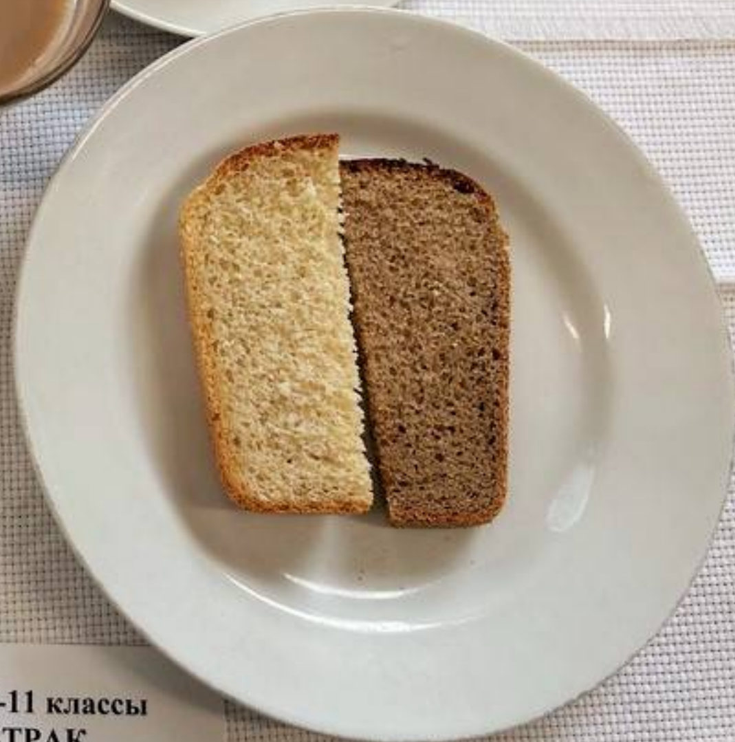
Льготная категория 5-11 классы (1 СМЕНА) – ЗАВТРАК