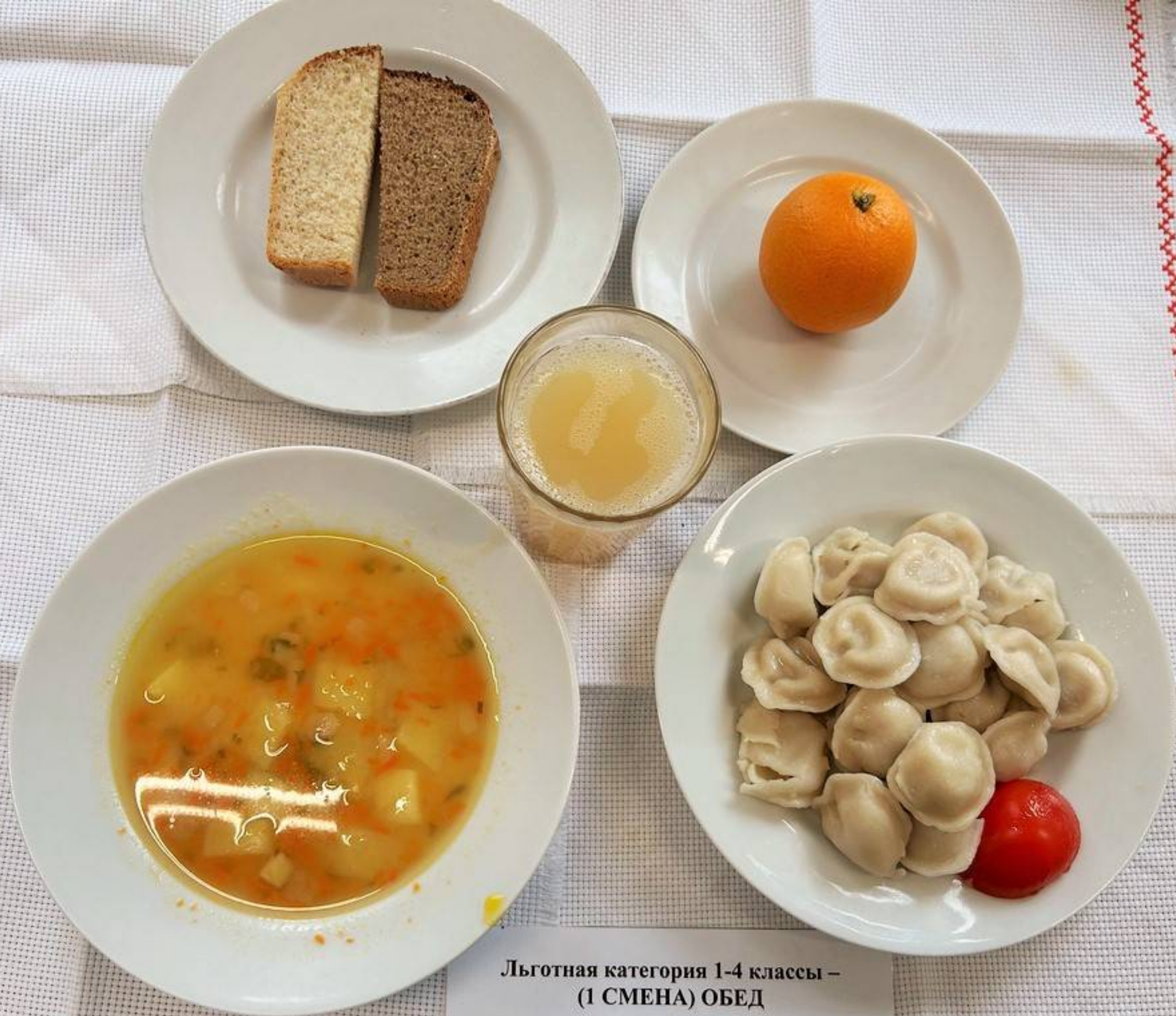
Льготная категория 1-4 классы – (1 СМЕНА) ОБЕД