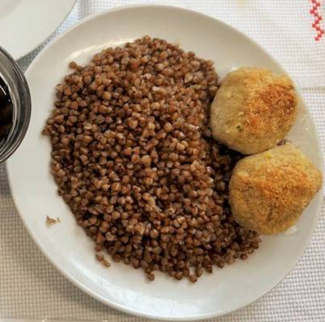
Платное питание 5-11 классы (2 СМЕНА) – ОБЕД КОМПЛЕКС 2