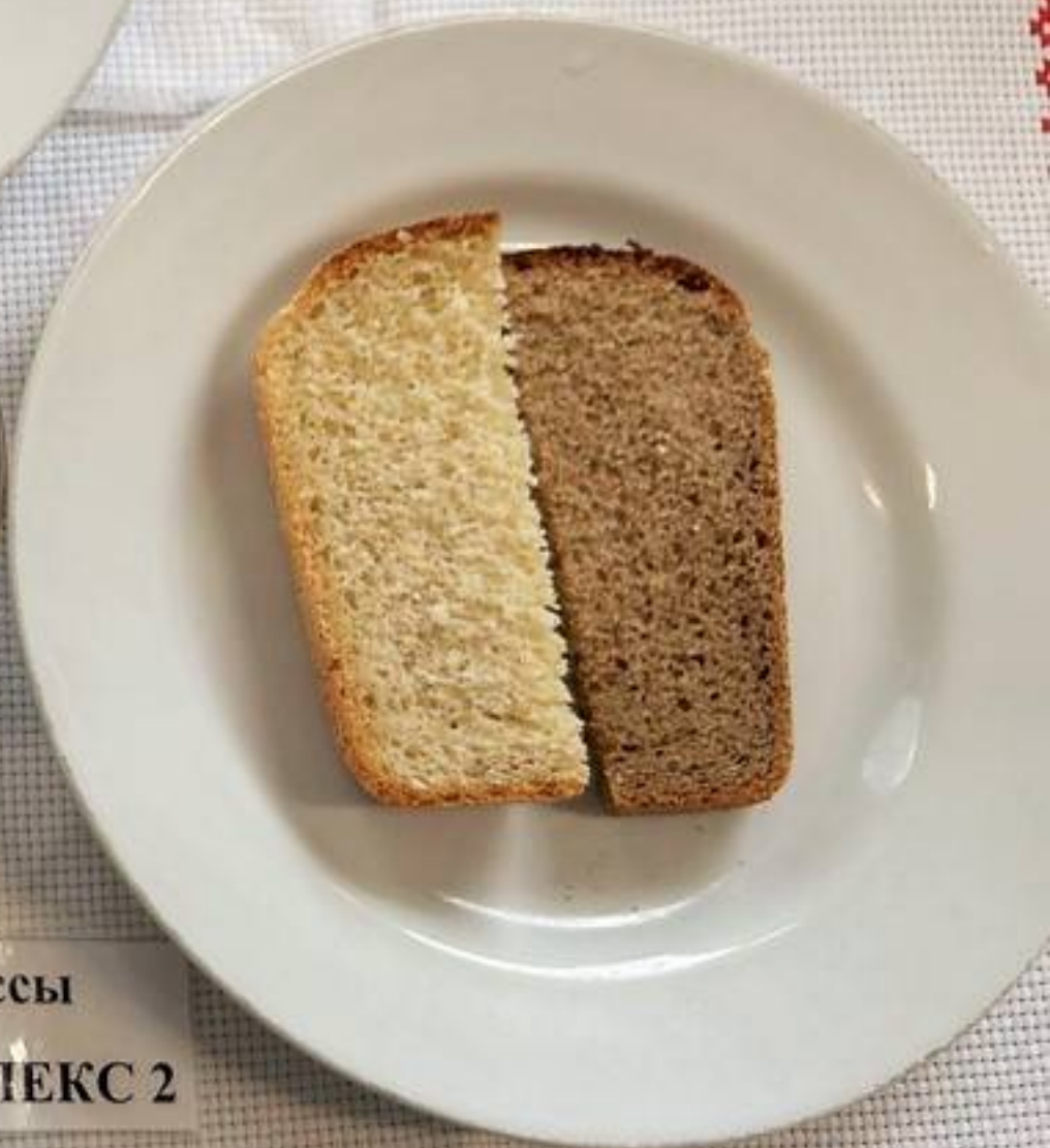
Платное питание 5-11 классы (1 СМЕНА) – Завтрак КОМПЛЕКС 2