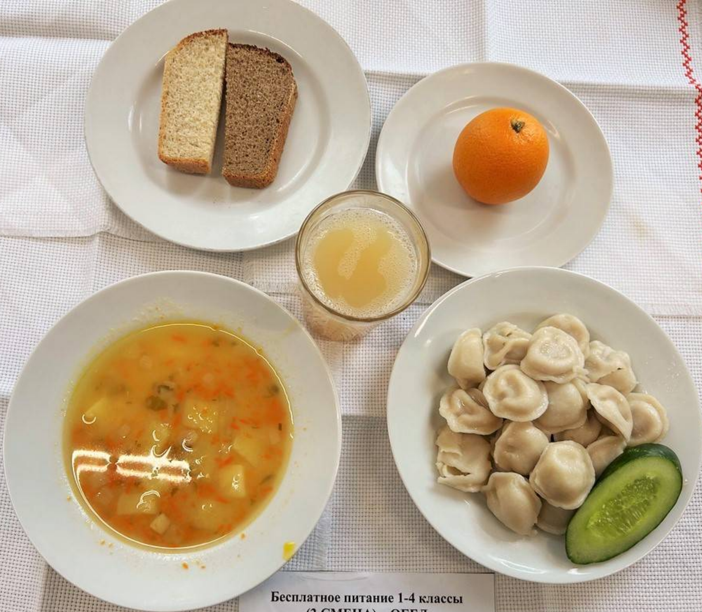
Бесплатное питание 1-4 классы (2 СМЕНА) – ОБЕД