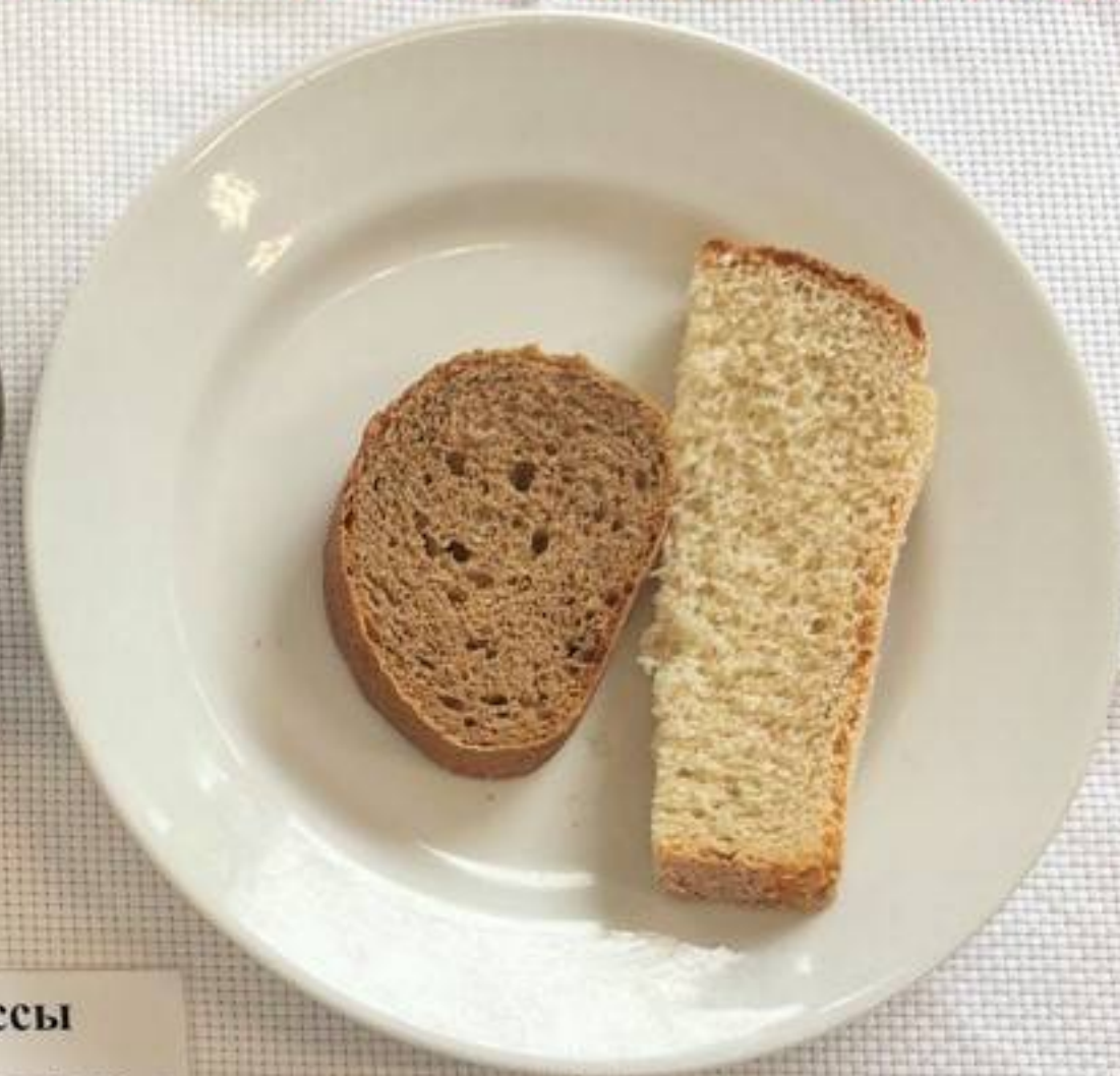
Платное питание 5-11 классы (1 СМЕНА) – Завтрак КОМПЛЕКС 2