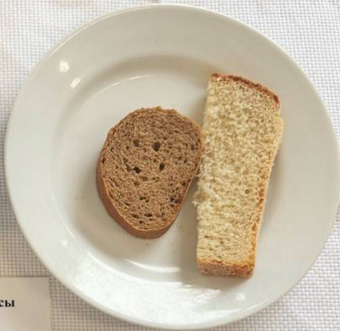
Льготная категория 5-11 классы (1 СМЕНА) – ЗАВТРАК