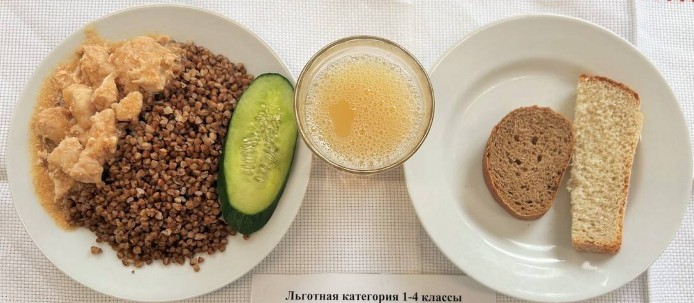
Льготная категория 1-4 классы (1 СМЕНА) – ЗАВТРАК