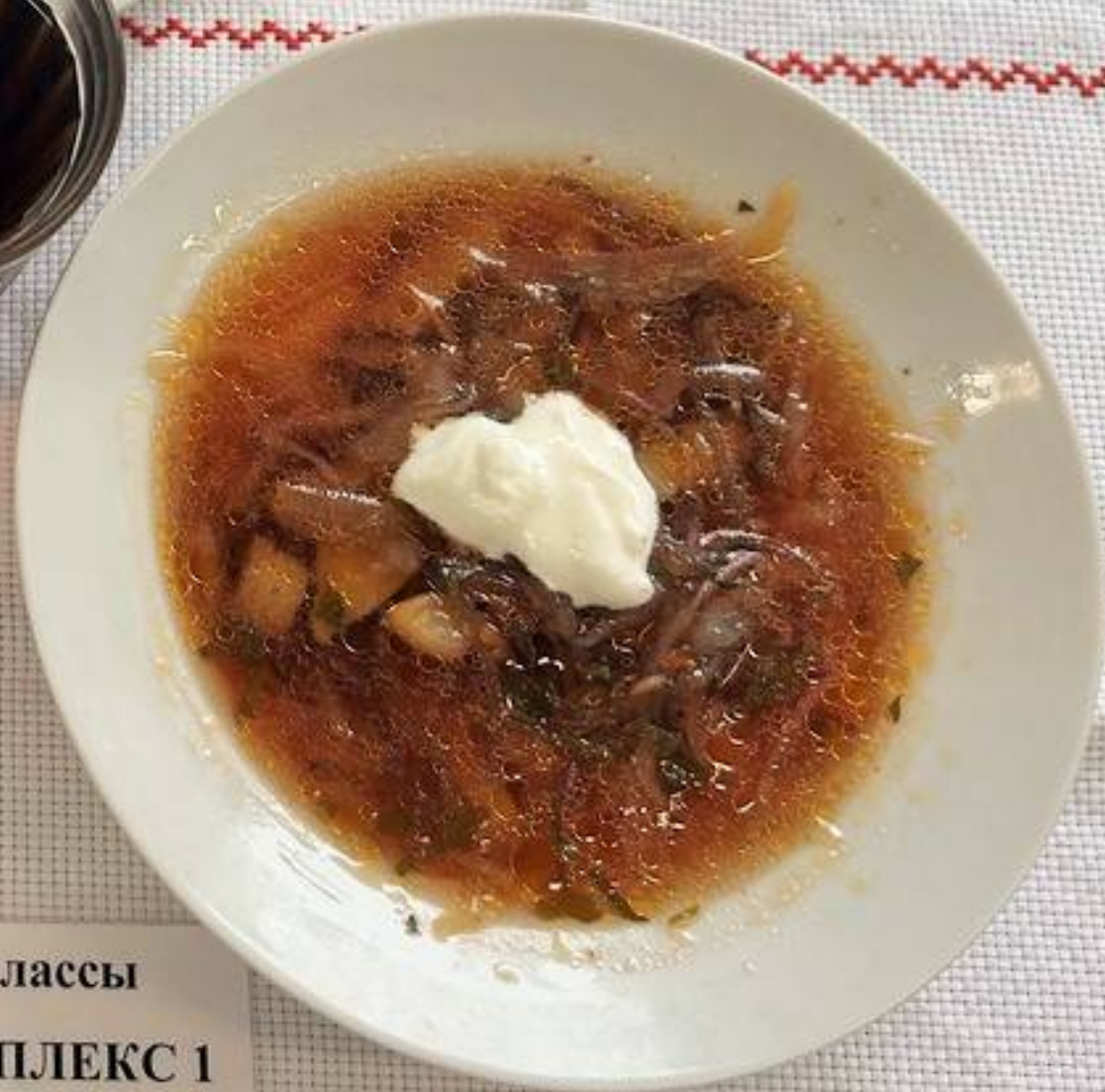
Платное питание 5-11 классы (2 СМЕНА) – ОБЕД КОМПЛЕКС 1