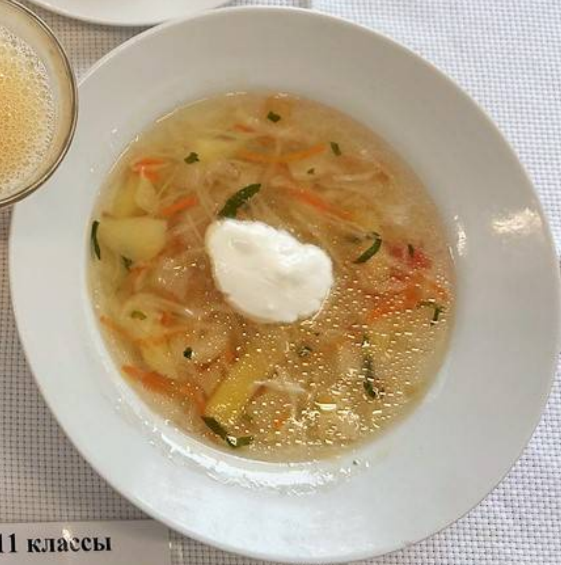
Платное питание 5-11 классы (2 СМЕНА) – ОБЕД КОМПЛЕКС 2