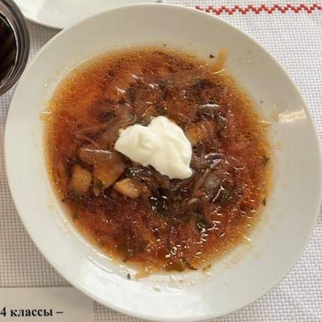
Льготная категория 1-4 классы – (1 СМЕНА) ОБЕД