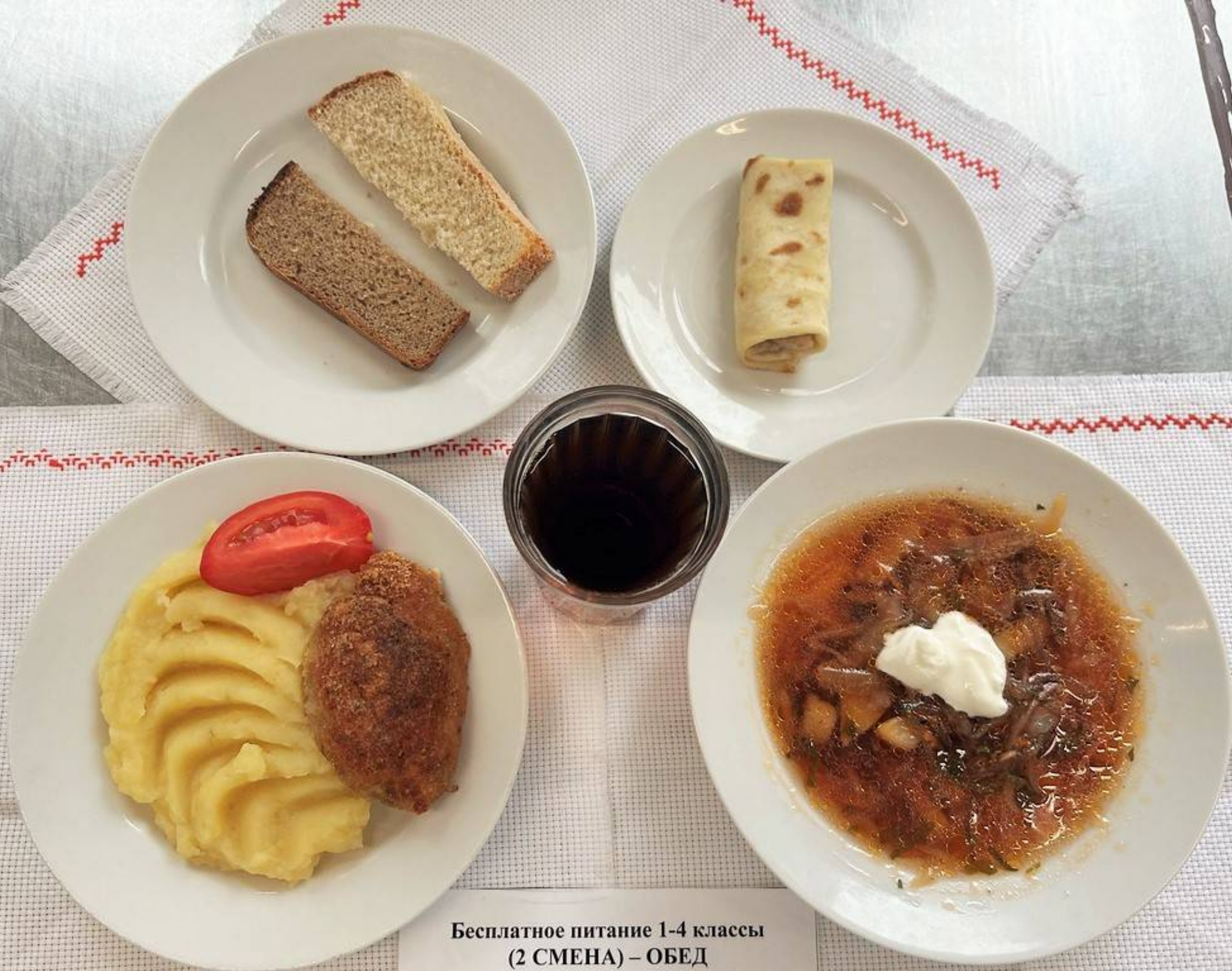
Бесплатное питание 1-4 классы (2 СМЕНА) – ОБЕД