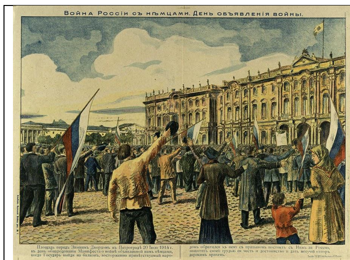
День объявления войны, 1914 год.

1. Слайд 2-3. Учитель предлагает сравнить изображения столицы России в 1914 году и в конце 1917 года.